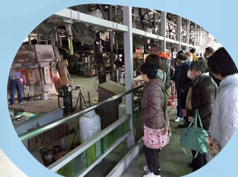
工場見学(自由参加)